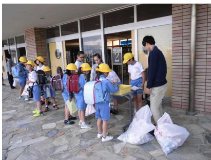
＜ボランティア委員会・アルミ缶、ペットボトルキャップの収集＞

「今日集まったアルミ缶は～ ペットボトルキャップは、OKgでした。これで、〇人分のワクチンが買えます」と、ランチルームで委員会児童が報告してくれています。