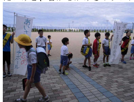
＜あいさつは心と心のキャッチボール＞ （委員会ののぼり旗の言葉より）

先月の学校だよりでもお伝えしましたが、本年度の本校の重点目標は「互いのよさを認め合い、自己有用感を育む指導の充実」です。自己有用感というのは、「人の役に立てた、人から感謝された、人から認められた」という感情です。各学年や委員会等でも子供たちのアイデアを生かした活動を進め、「人とかがかわることって楽しい。自分もできることがある」と思えるように工夫しています。