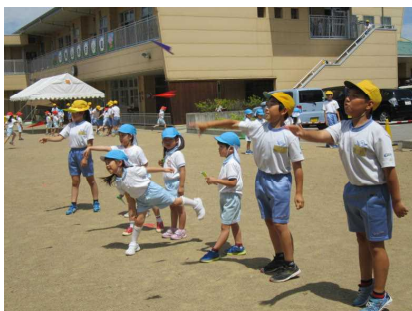
＜5年生「総合的な学習」 あおい園との交流＞

「今日集まったアルミ缶は～ ペットボトルキャップは、OKgでした。これで、〇人分のワクチンが買えます」と、ランチルームで委員会児童が報告してくれています。