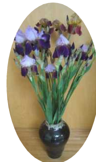
地域の方から頂いた美しい花が子供たちを迎えてくれました。

「やっと学校が始まった。友達と遊びたい」「あと半分の人と早く会いたいな」と目を輝かせている子供たちを見ると、子供たちの命と健康を守りながら、充実した学校生活を送らせてあげたいと強く思います。たくさんの制限はありますが、こんな時だからこそ、人の優しさ、力を合わせるものの価値に気付くことができます。子供たちが大人になったときに、「大変だったけど、楽しかったね」と言えるように、教職員一同、知恵を絞って取り組んでいきますので、よろしくお願いいたします。