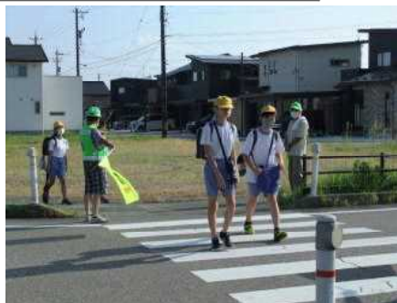
【秋の交通安全指導】

美しい環境、安全な登下校を PTA の皆様、地域の方々が支えてくださっています。ありがとうございます。