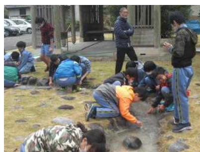
6年生：埋蔵文化財センター…勾玉づくりや火起こし体験、館内見学を通して古代人の暮らしを学びました。