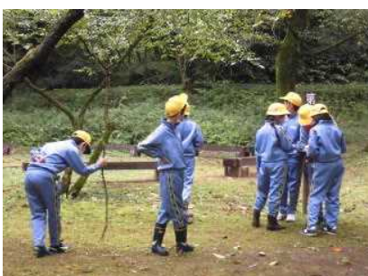
5年生：富山県美術館・呉羽青少年自然の家…芸術に触れた後は、呉羽山でオリエンテーリング! 秋を満喫!