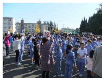
＜津波を想定し、なかよし公園に避難＞

普段の生活の中でも、その子なりの優しさ、強さ、よさが発揮されている場面はいろいろあるように思います。当たり前と思わずに、それを認め伝えていける大人でありたいと思います。