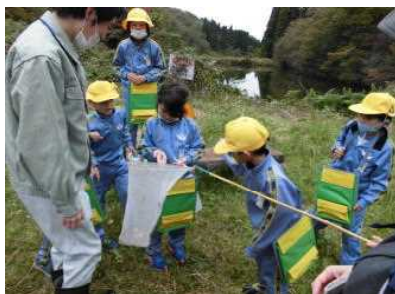
2年生：ねいの里…職員の方と森を散策し自然の秘密をたくさん教えていただきました。