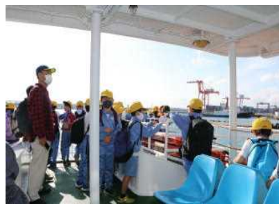
3年生：民俗民芸村・海王丸パーク…昔の道具を見たりフェリーに乗ったりして人間の知恵を学びました。