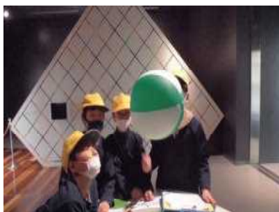
4年生：クリーンピア射水・ミライクル館、富山市科学博物館…理科と社会の学習を追体験できました。