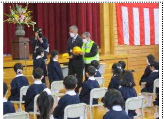
<交通安全帽子贈呈式>

代表児童は、「あったか言葉・行動を大切にしているところ、仲よしグループの活動があるところ、おいしい給食を食べられるところが太閤山小学校のすてきなところ。ぼくたちと一緒に楽しい学校生活を送りましょう」と話しかけました。明日も学校へ行くのが楽しみになる仲間づくりをしていきたいと思っています。