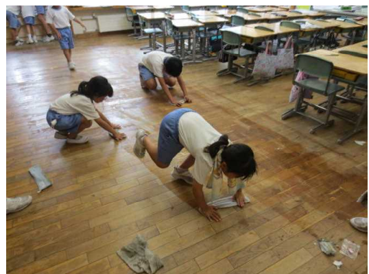
教室の床を水ぶきする子供たち

1学期の汚れをしっかりと落とし、気持ちよく2学期をスタートすることができそうです。