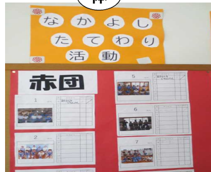
〈なかよし縦割り活動の記録〉