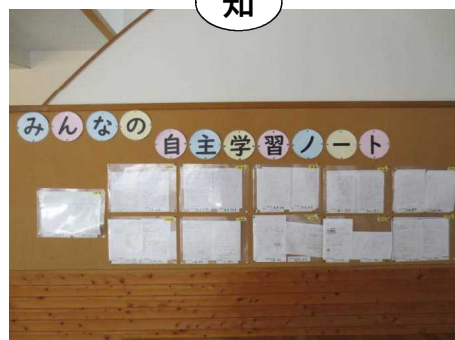
〈自主学习ノートの掲示〉