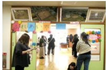
【人気のふれあい市】