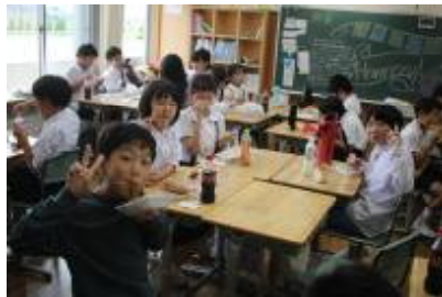
【バザーを利用したの昼食タイム】