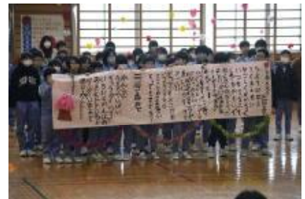
【全校児童から歌のプレゼント】

ました。また全校児童で「♪6年生へ歌のプレゼント（となりのトトロの替え歌）」を心を込めて歌いました。出し物を楽しそうに見る6年生の優しいまなざしや満面の笑顔が印象的でした。