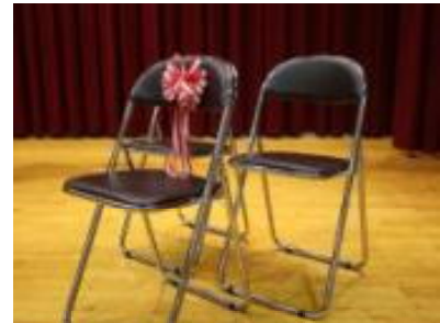
卒業記念品：パイプ椅子