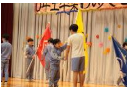
【5年生へ引き継ぎ式】

次は引き継ぎ式です。団旗と委員会や縦割り清掃のファイルが6年生から5年生へ手渡され、6年生は5年生へエールを、5年生は伝統を受け継ぐ決意の言葉を述べました。集会の最後は6年生からのお返しです。在校生へのお礼の気持ちを込めて「♪そよ風のデュエット」を演奏しました。また、縦割り班活動で使う「班番号ボード」をプレゼントしました。