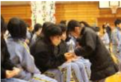
【3年：プレゼントわたし】