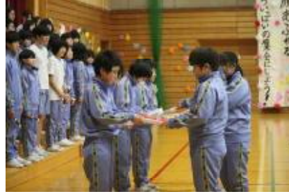
【6年生から在校生へプレゼント】