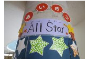
挨拶オールスター

2月26日(水)、全校でその成果を讃え、ゲームをして楽しみました。これからも挨拶運動を続け、学校や地域を明るくしていきたいです。