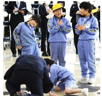
[大空級の授業風景]

保護者の皆様には、下校後の過ごし方等ご協力いただきありがとうございました。また、学校支援ボランティアの方々には駐車場案内等をしていただき、ありがとうございました。