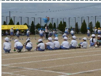
ダンシング玉入れ